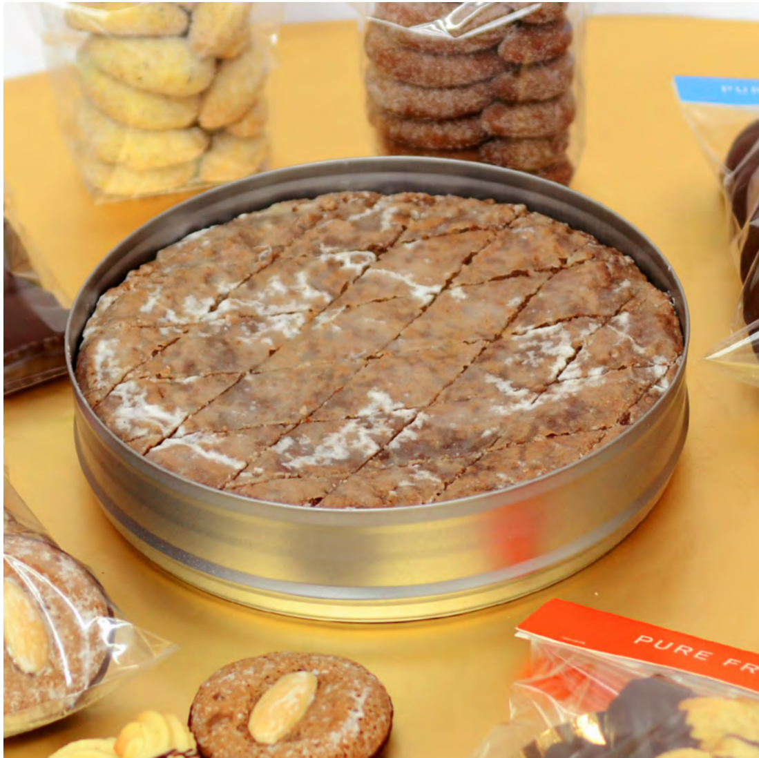
Berliner Brot in der Blechdose Durchmesser 18 cm 18,50 Euro