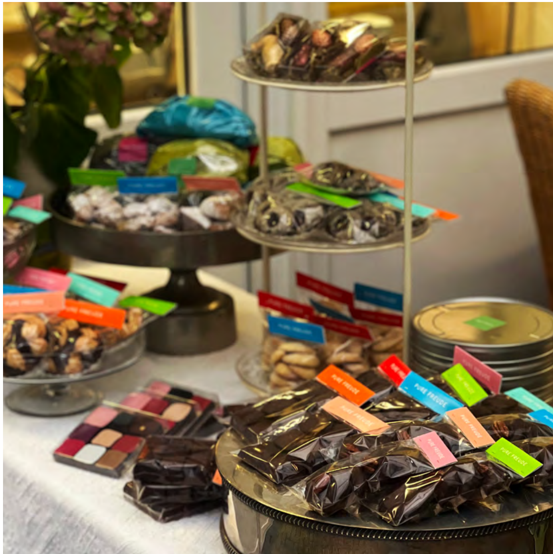
Weihnachtssortiment der Pâtisserie PURE FREUDE 2025