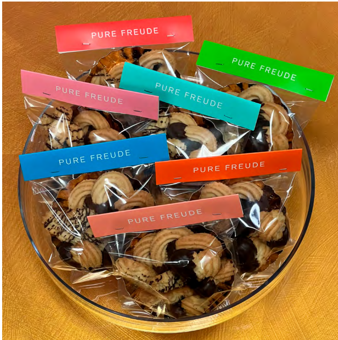
Spritzgebäck mit Zartbitter Schokolade 6,50 Euro