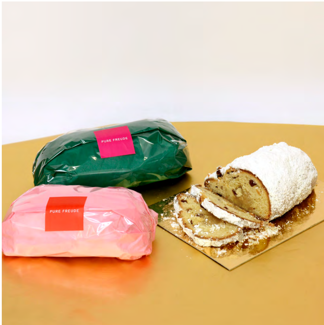
Stollen mit Marzipan als kleiner Stollen und als Stollenkonfekt ca. 250g · 15,00 Euro | Konfekt · 9,00 Euro